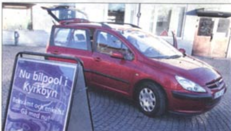
En bil för alla. Låna bilen när du behöver den – tvätt och reparation sköts av Stansbil bilpool.